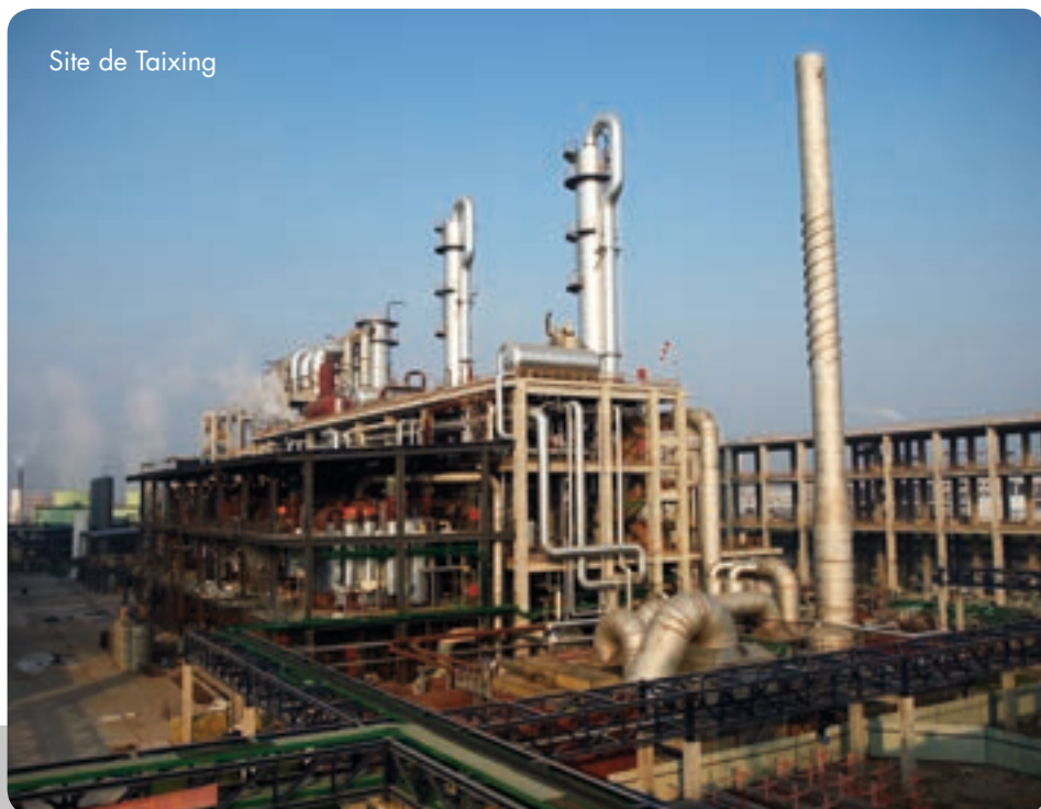
Site de Taixing

Ce projet permet à Arkema de continuer à accompagner ses clients sur les marchés porteurs des superabsorbants, des peintures, des adhésifs et du traitement de l'eau, et de conforter sa place parmi les leaders mondiaux des acryliques.